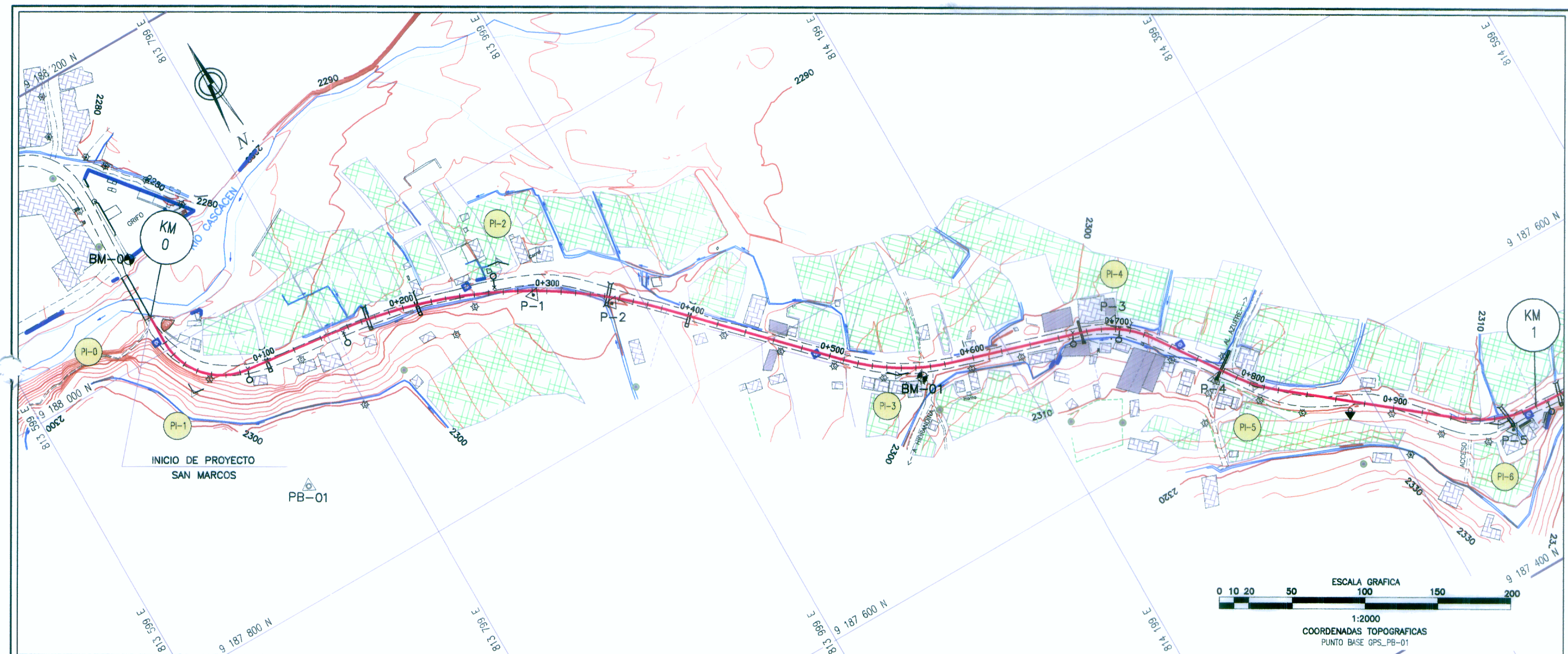
CUADRO DE COORDENADAS Y ELEMENTOS DE CURVAS