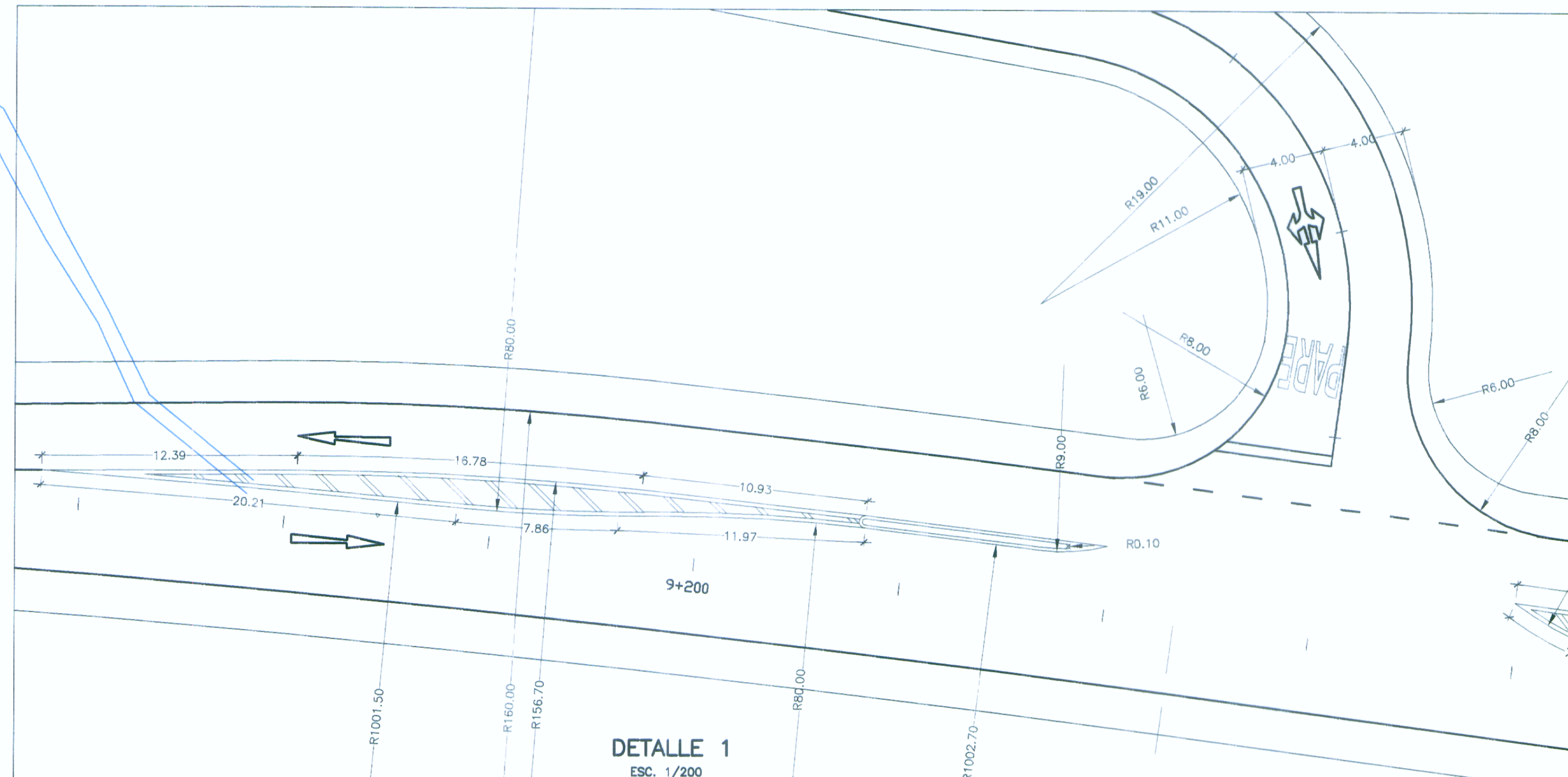
DETALLE 1 ESC. 1/200