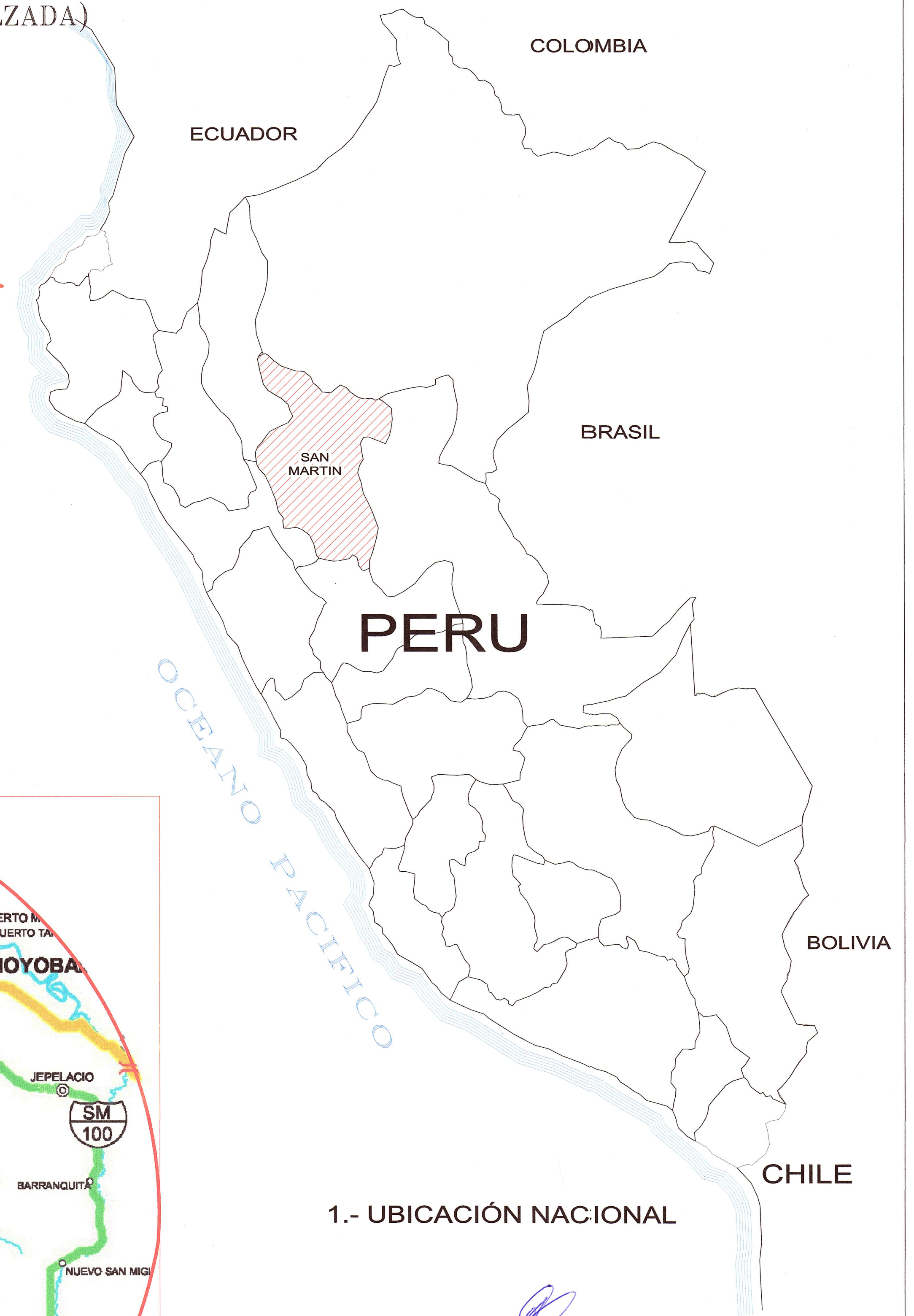
1.- UBICACIÓN NACIONAL

JNR CONSULTORES S.A. ING. ENRIQUE COX CASSINELLI C.R. 22547 JNR CONSULTORES S.A. ING. ANDRÉS DE LINIGOS LEÓN Ingeiería, Trazo y Diseño C.R. 22547