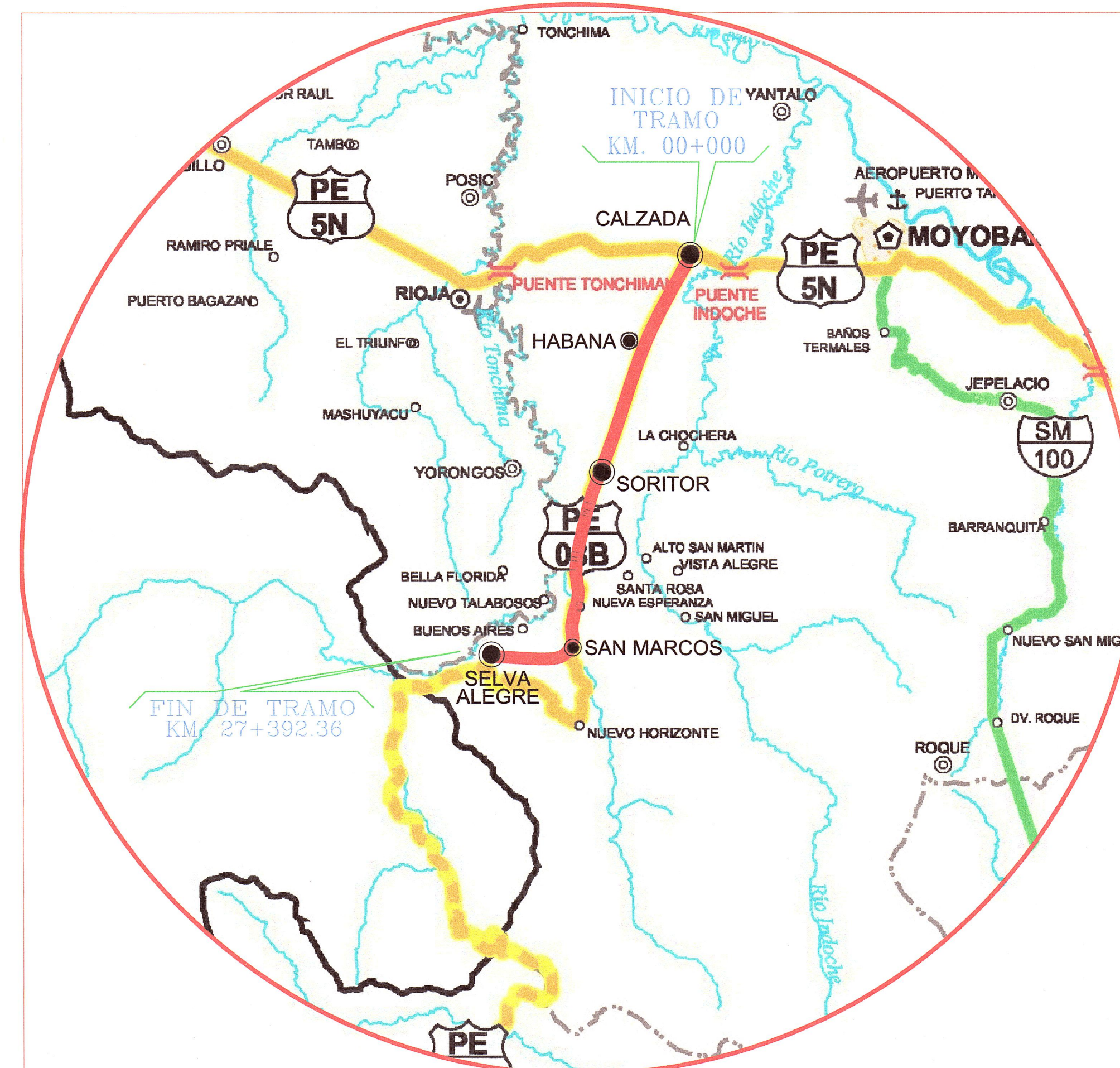
3.- UBICACIÓN LOCAL