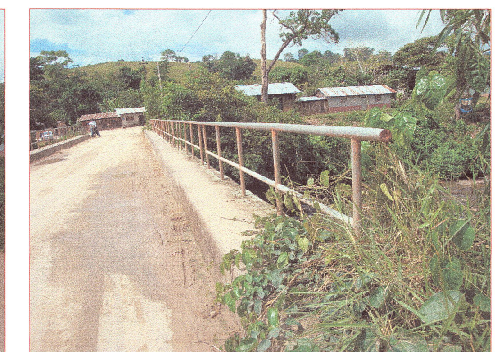
02 Vista de la vereda