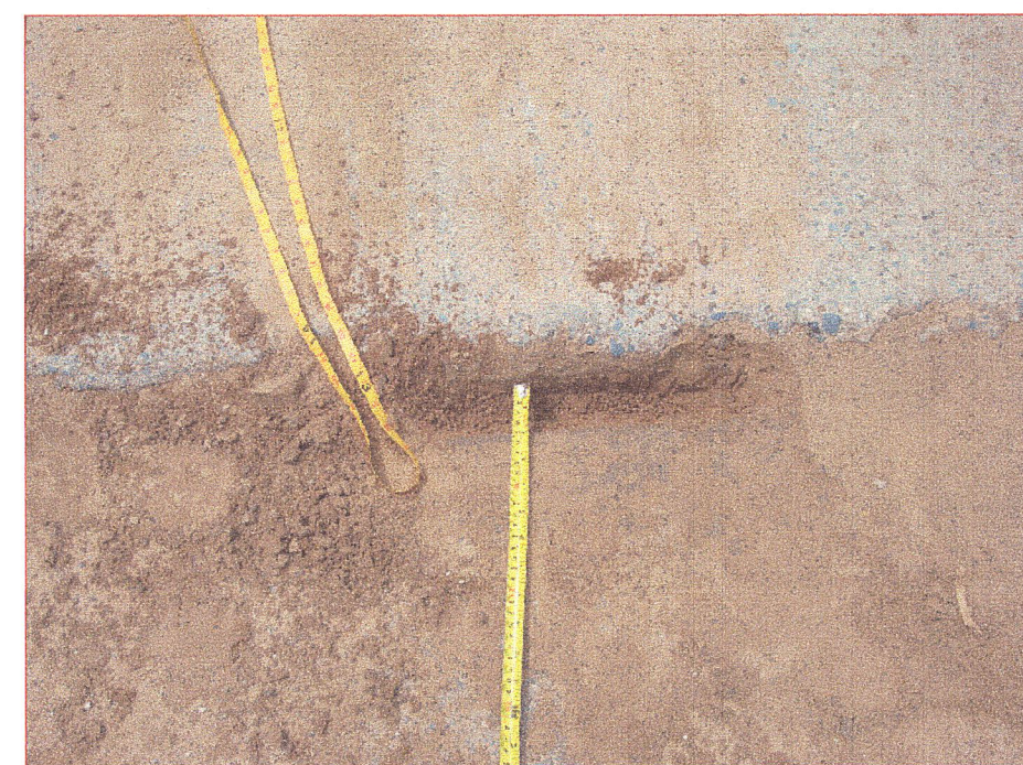
05 Vista de la junta de dilatacion