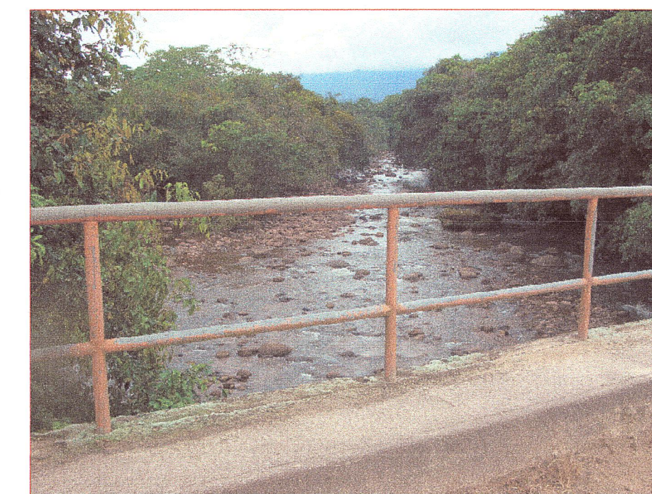
03 Vista de barandas del puente