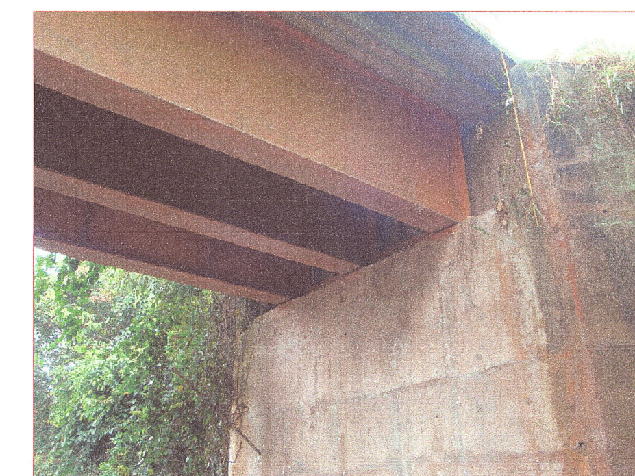
09 Vista de apoyos en estribos