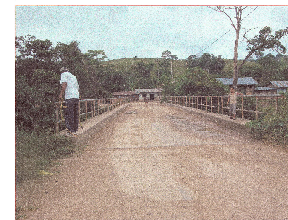
01 Vista de la superficie de rodadura