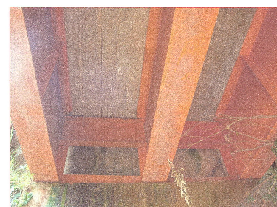
07 Vista de las vigas longitudinales