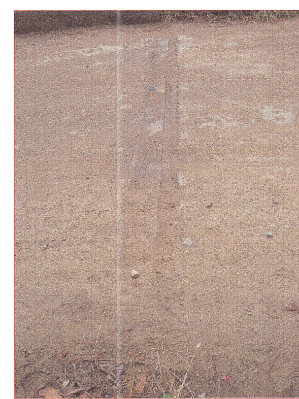
06 Vista de la junta de dilatacion