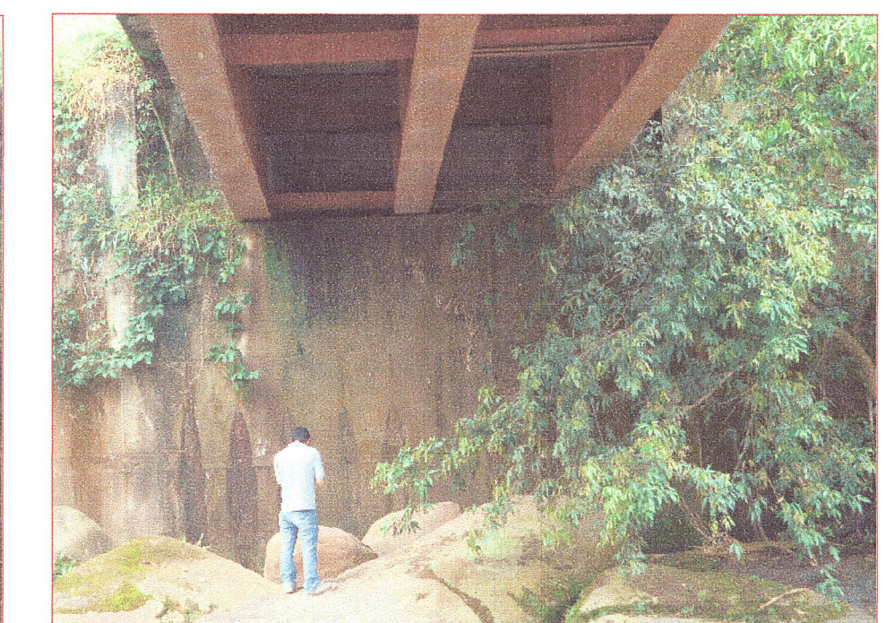
10 Vista de pantalla de estribo derecho