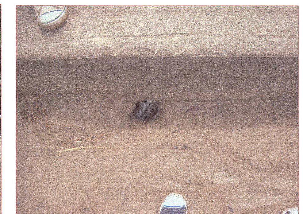
04 Vista de sistema de drenaje