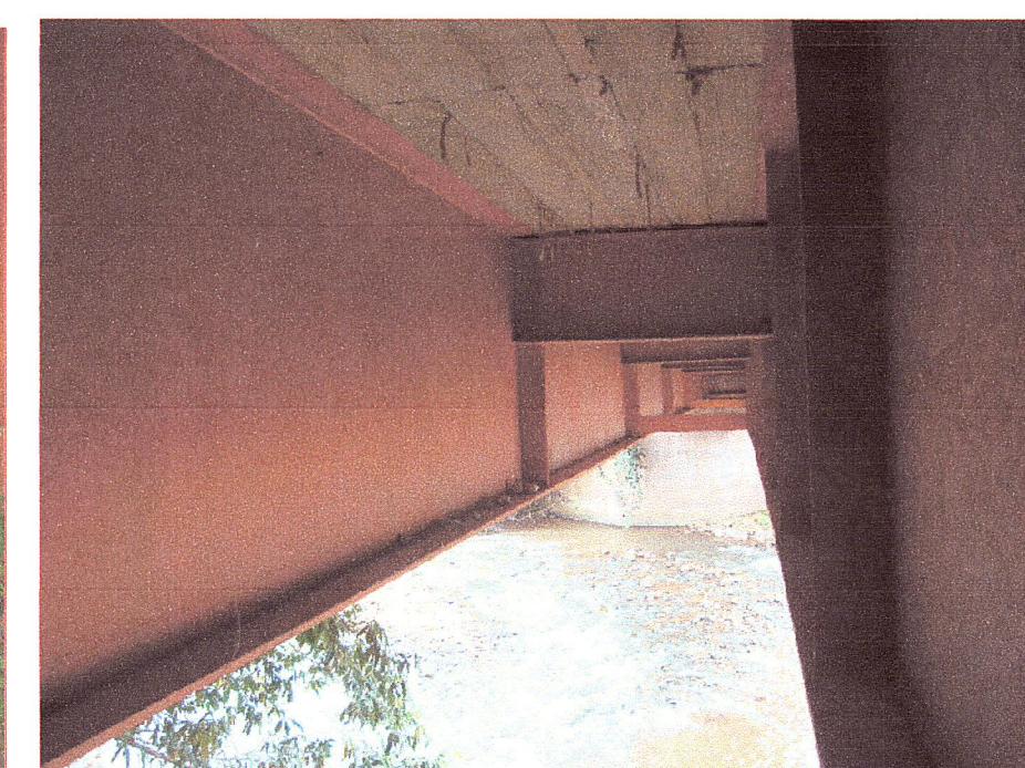
08 Vista de las vigas longitudinales y diafragmas