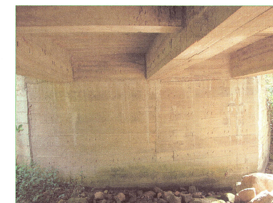
09 Vista de esribos del puente