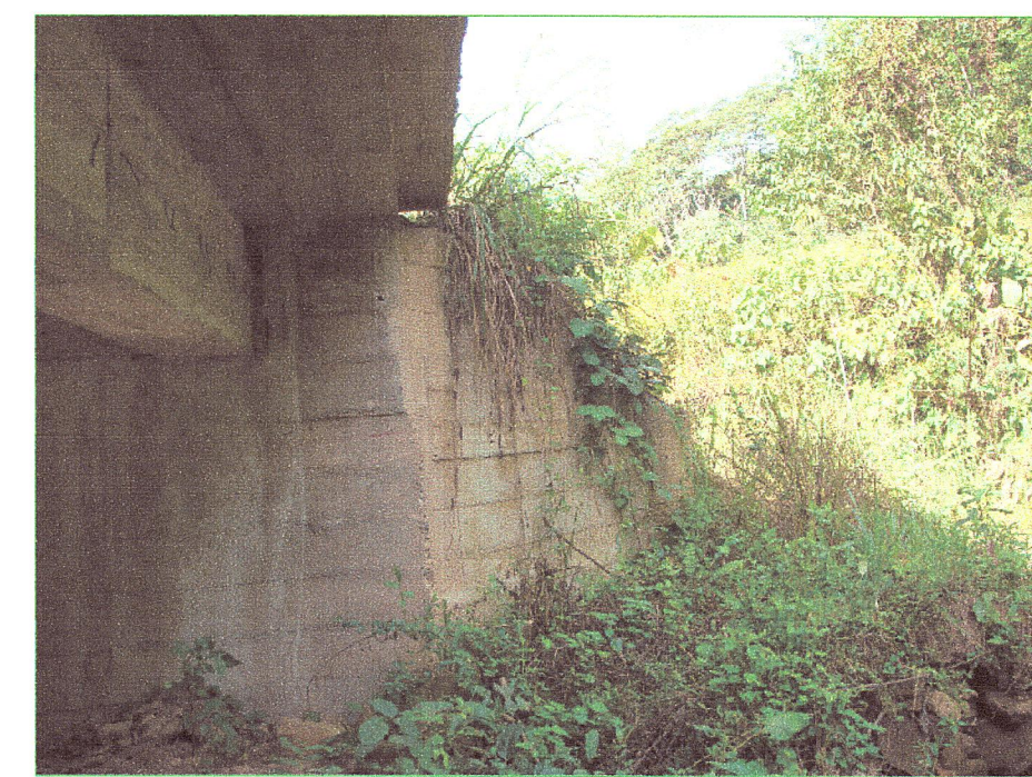
06 Vista de apoyos de viga en esribos