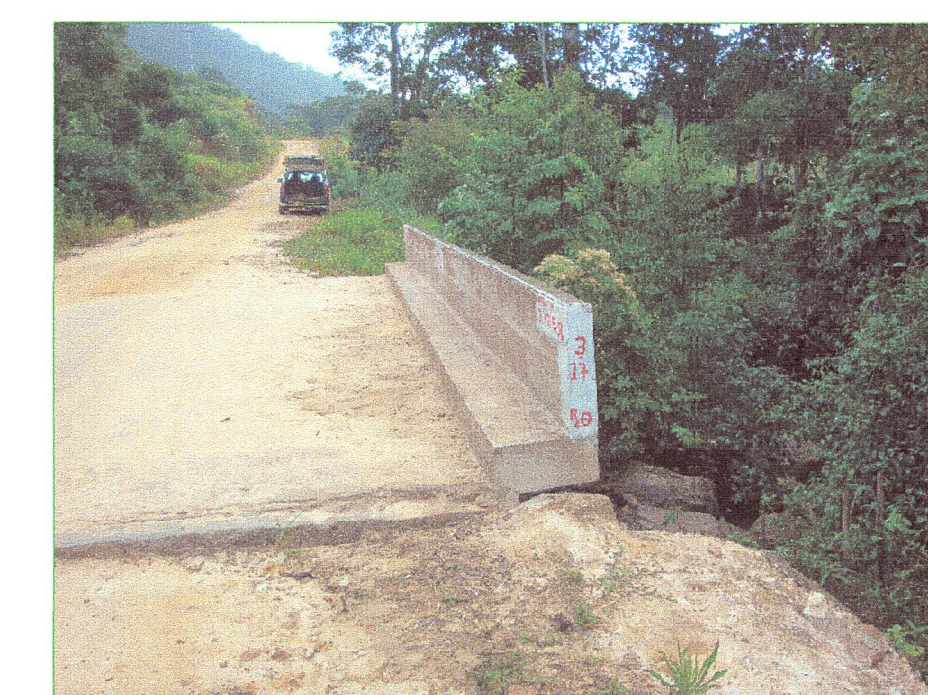
04 Vista de vereda y parapeto que estan como barandas del puente