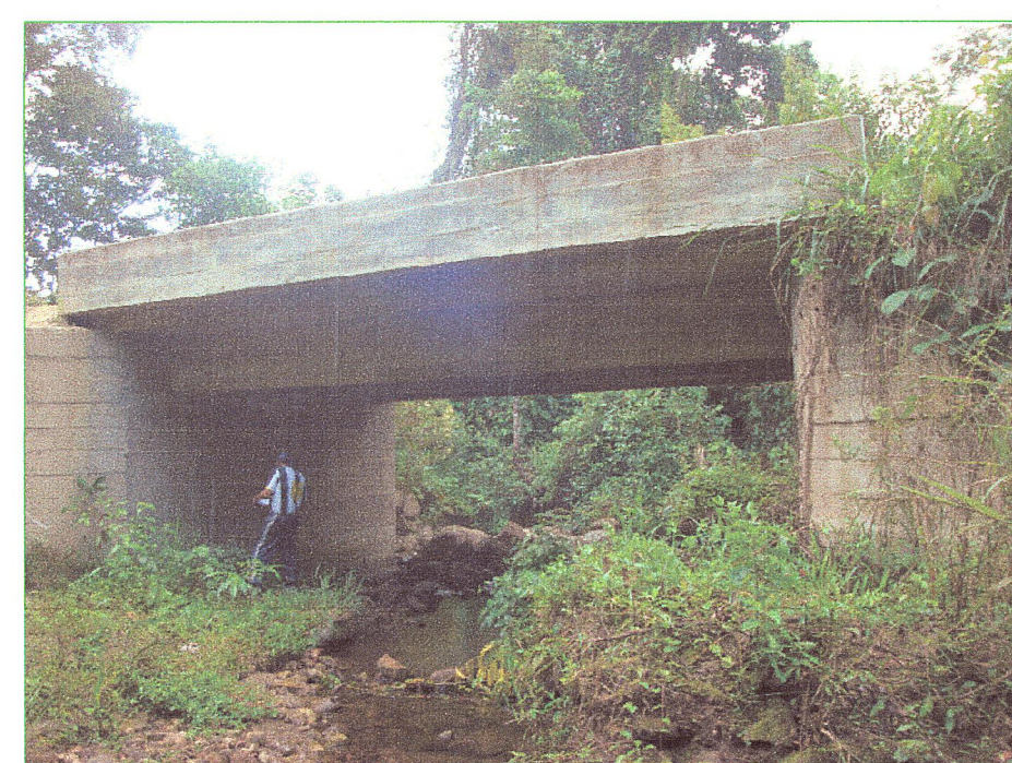
05 Vista lateral de vigas del puente

JNR CONSULTORES S.A. Ing. ESTRUCTURAS CASINELLI Calle de la Industria No. 2884