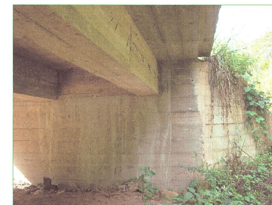
07 Vista de vigas inferiores del puente