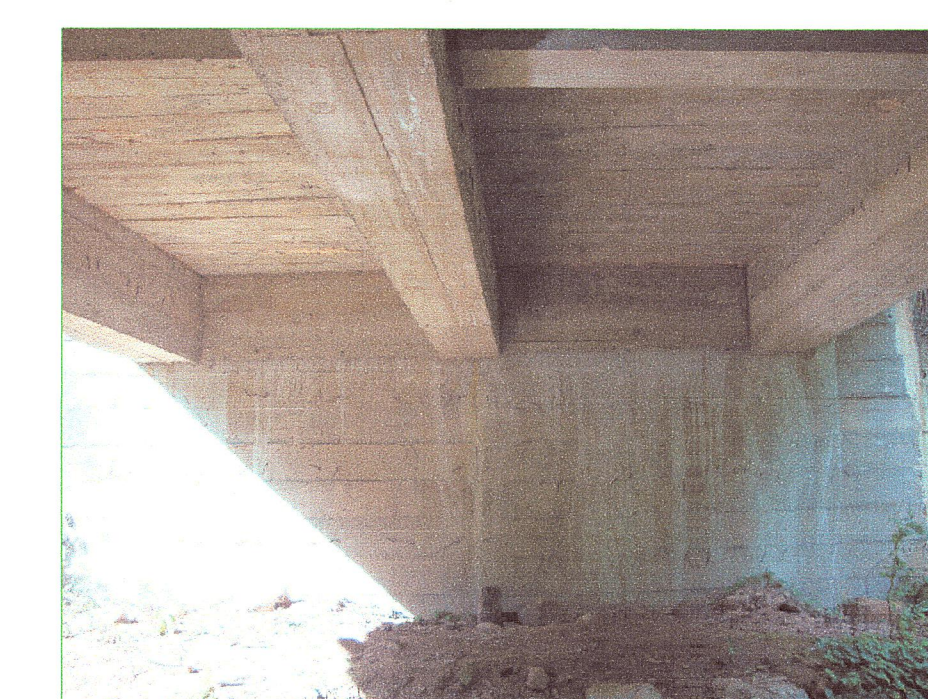
08 Vista de estribo del puente