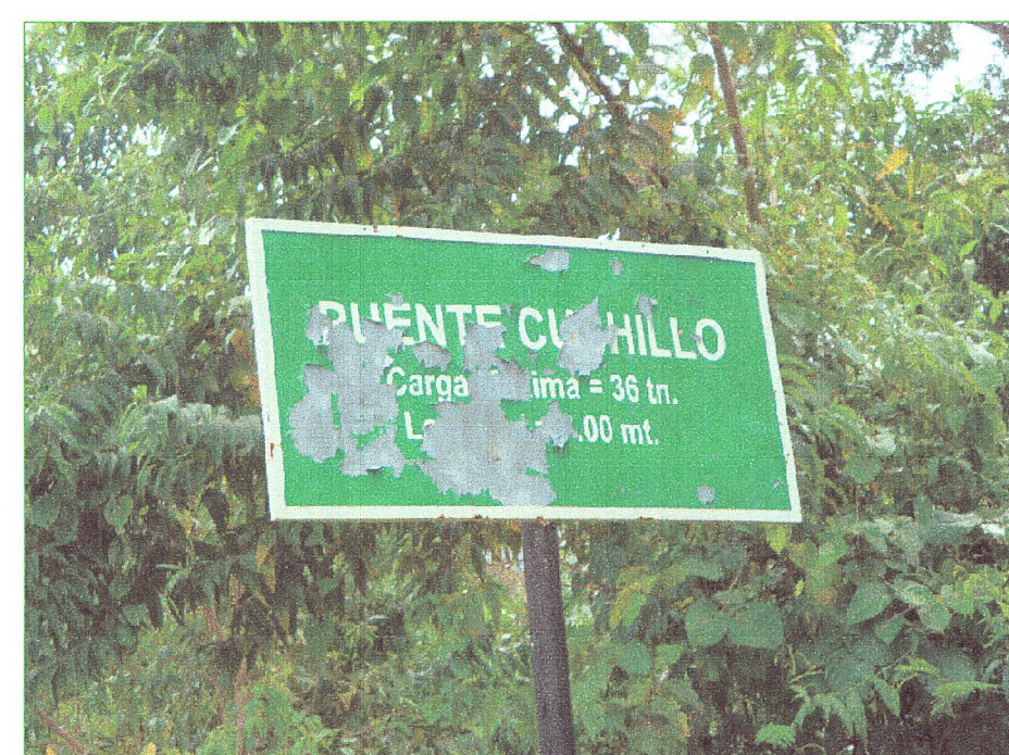
01 Cartel de obra