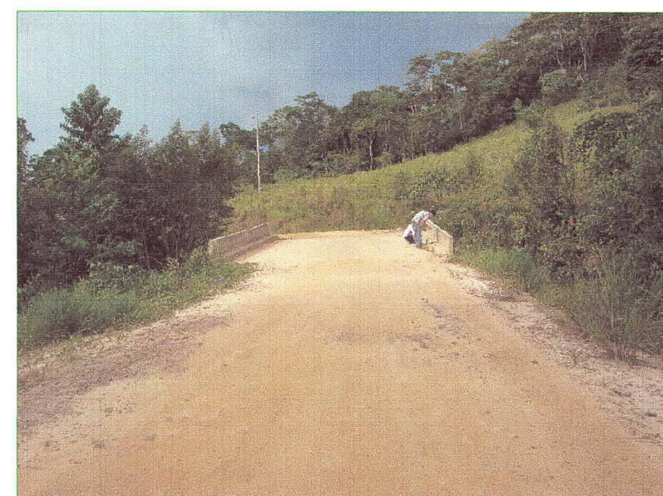
02 Vista de la superficie de rodadura