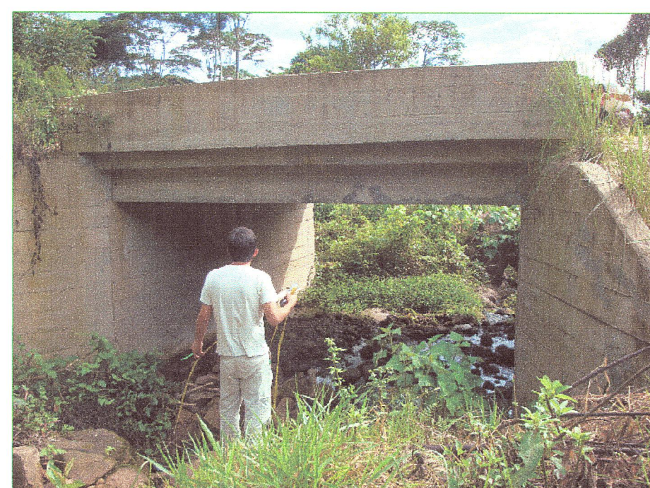
02 Vista lateral del puente