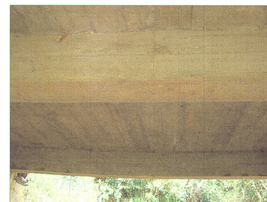
07 Vista de vigas inferiores del puente