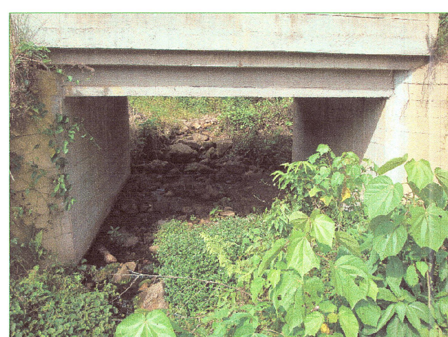
05 Vista lateral de vigas del puente