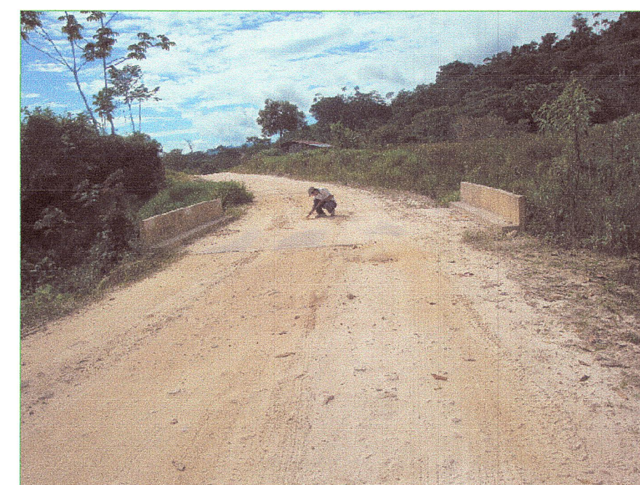
03 Vista de la superficie de rodadura