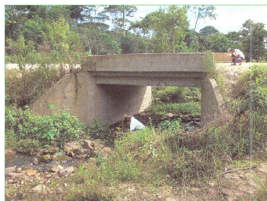
01 Vista desde aguas arriba del puente