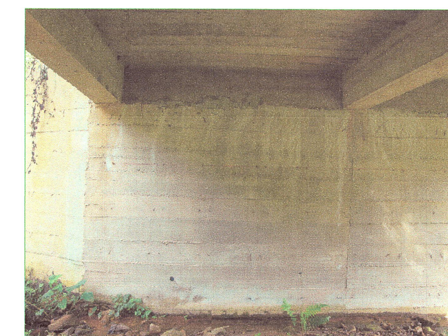
08 Vista de estribo del puente