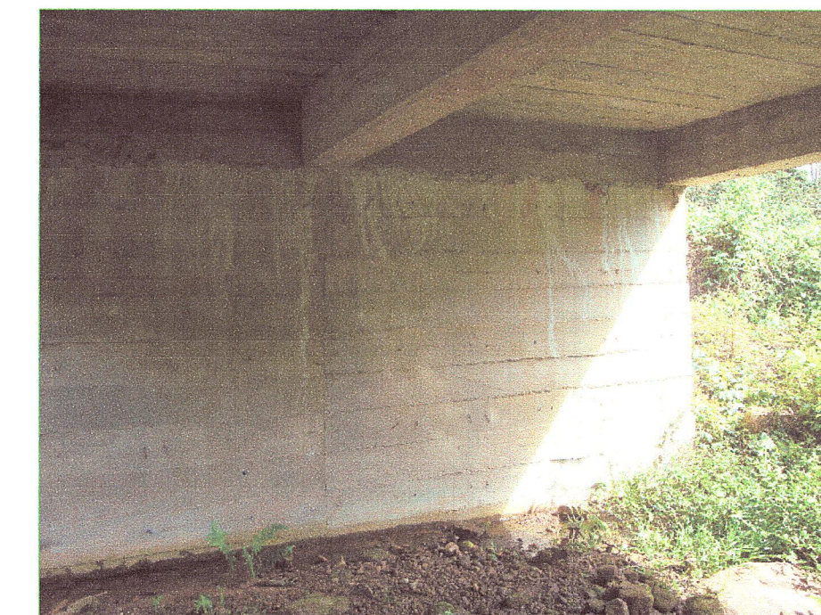
09 Vista de esribos del puente