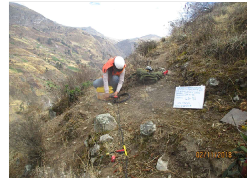
FOTO DE LA LS - 90