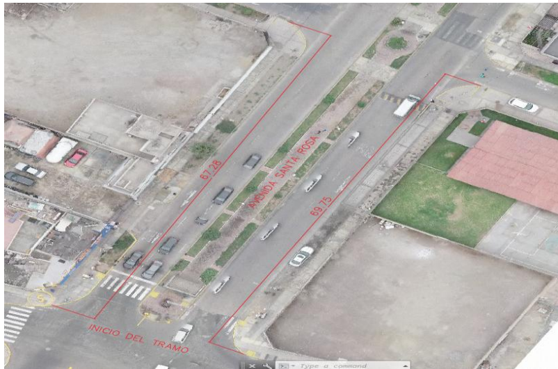
IMAGEN : ORTOFOTO DE LA AVENIDA SANTA ROSA