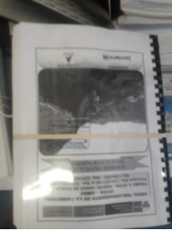
Foto Bitacora: Foto Bitacora 2: Foto Bitacora 3: Foto Bitacora 4: Foto Bitacora 5: Foto Bitacora 6:

Confirma Bitacora: Si Nro Informe: 001 Fecha Informe: 10-04-2019 Nombre De La Obra: Carretera Oyon - Ambo, Tramo I: Oyon - Desvío Cerro de Pasco Personal Encargado: VILCHEZ ESPINOZA JOHNATHAN ARTURO