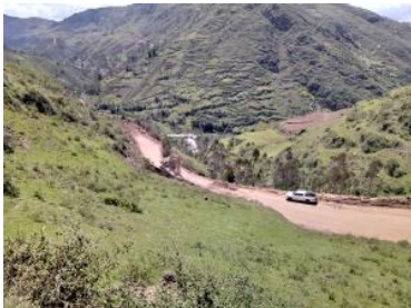
Foto1: Foto2: Foto3: