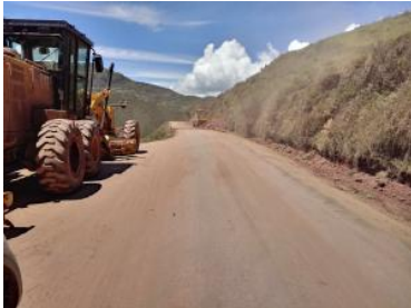
Foto1: Foto2: Foto3: