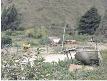
Foto1: Foto2: Foto3:

CDescripcion_____: Trabajos de levantamiento topográfico efectuado por el Contratista, en el Km 19+700.