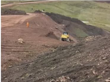
Foto1: Foto2: Foto3: