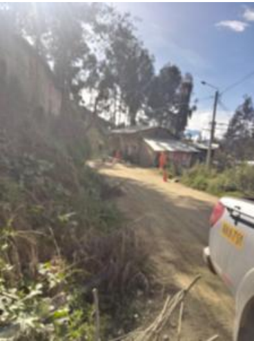
Foto1: Foto2: Foto3:

CDescripcion_____: Nivelación topográfica efectuada por personal del Contratista, en el Km 23+650.