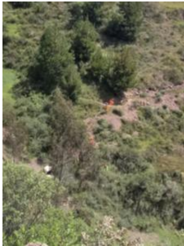
Foto1: Foto2: Foto3:

CDescripcion_____: Levantamiento topográfico realizado por el Contratista, en el Km 46+400.