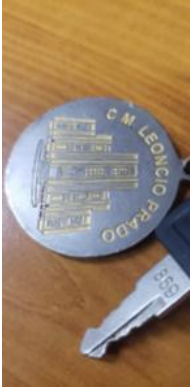
Foto Bitacora 2: