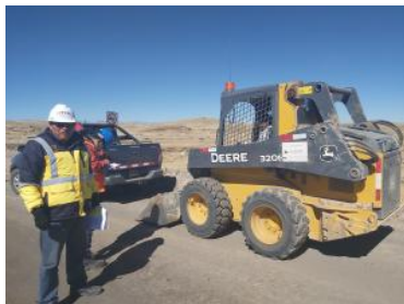
Foto1: Foto2: Foto3: