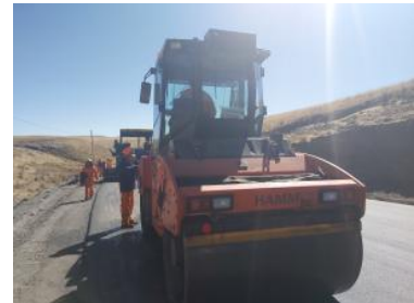
Foto1: Foto2: Foto3: