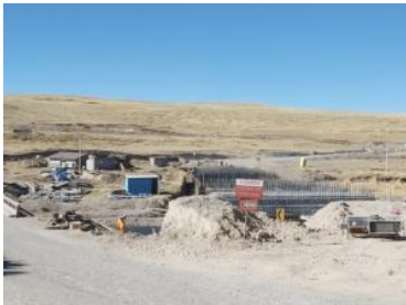
Foto1: Foto2: Foto3:

CDescripcion_____: Del km 145+060 al km 145+270