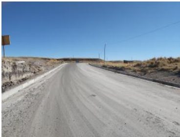
Foto1: Foto2: Foto3:

CDescripcion_____: Del km 144+640 al km 145+050