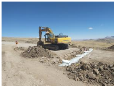
Foto1: Foto2: Foto3: