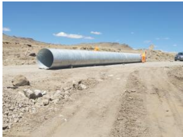
Foto1: Foto2: Foto3: