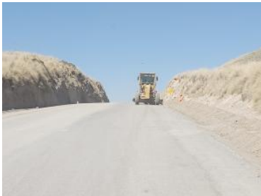
Foto1: Foto2: Foto3: