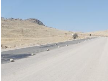
Foto1: Foto2: Foto3: