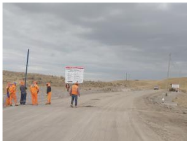
Foto1: Foto2: Foto3:

CDescripcion_____: Tramo del km 153+570 al km 152+880