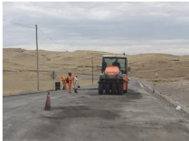
Foto1: Foto2: Foto3:

CDescripcion_____: Tramo del km 152+600 al km 153+000