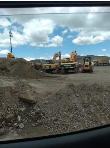
Foto1: Foto2: Foto3:

CDescripcion_____: Se muestra la Maquinaria Paralizada en el sector Negromayo