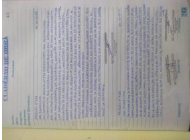
Foto Bitacora: Foto Bitacora 2: Foto Bitacora 3: Foto Bitacora 4: Foto Bitacora 5: Foto Bitacora 6:

Confirma Bitacora: Si Nro Informe: 02 Fecha Informe: 04-12-2019 Nombre De La Obra: Carretera Patahuasi - Yauri - Sicuani, tramo: Negromayo- Yauri-San Genaro Personal Encargado: R O M M E L C H A N C A RAMIREZ