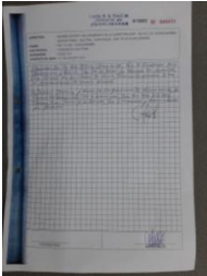
Foto Bitacora: Foto Bitacora 2: Foto Bitacora 3: Foto Bitacora 4: Foto Bitacora 5: Foto Bitacora 6:

Confirma Bitacora: Si Nro Informe: 61 Fecha Informe: 06-12-2019 Nombre De La Obra: Carretera Emp. Pe-1n J (Dv. Huancabamba) - Buenos Aires - Salitral - Dv. Canchaque - Emp. Pe-3n - Huancabamba, Tramo: Km. 71+600 - Huancabamba Personal Encargado: Bances Nizama Eddy Wilmer