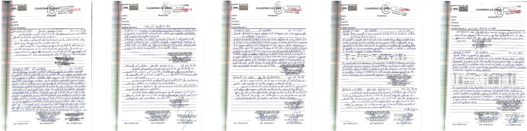
Foto Bitacora: Foto Bitacora 2: Foto Bitacora 3: Foto Bitacora 4: Foto Bitacora 5: Foto Bitacora 6:

Asunto: Coordinaciones diversas en la oficina de Supervisión de obra.