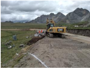
Foto1: Foto2: Foto3: