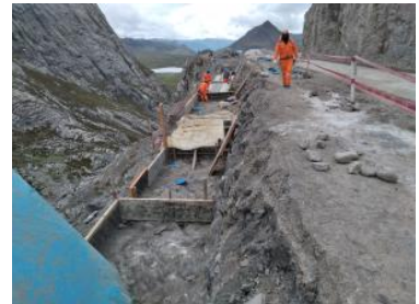
Foto1: Foto2: Foto3: