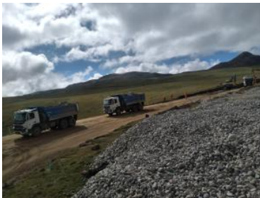
Foto1: Foto2: Foto3: