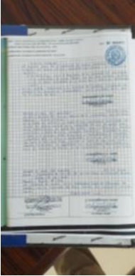
Foto Bitacora 3: