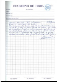
Foto Bitacora: Foto Bitacora 2: Foto Bitacora 3: Foto Bitacora 4: Foto Bitacora 5:

Confirma Bitacora: Nro Informe: Fecha Informe: Nombre De La Obra: Personal Encargado: Si N 013-PVN - MJQ Y - 2020 26-12-2020 HUANUCO - HUALLANCA (T1) MICHAEL JESUS QUISPE YAURI.