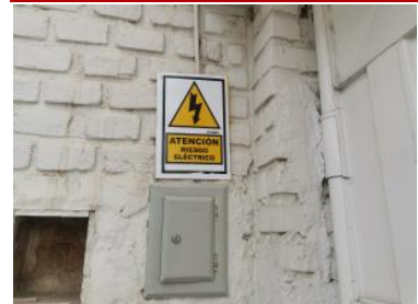
Ver imagen completa