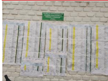
Ver imagen completa