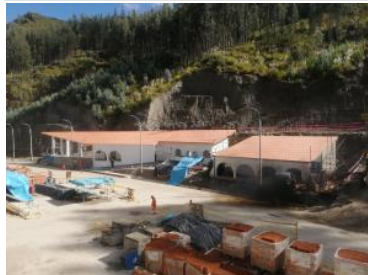
Ver imagen completa