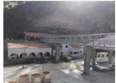
Ver imagen completa