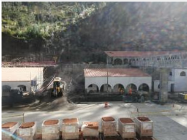
Ver imagen completa