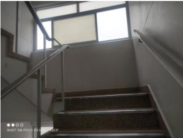
Ver imagen completa