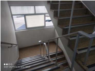
Ver imagen completa