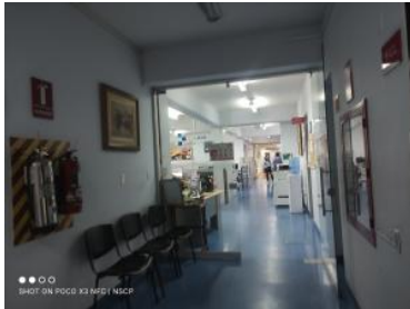
Ver imagen completa