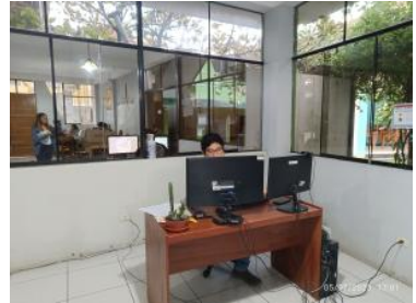
Ver imagen completa