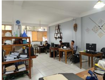
Ver imagen completa