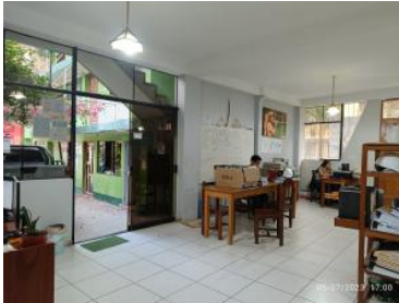
Ver imagen completa