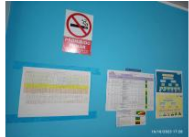
Ver imagen completa