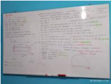
Ver imagen completa