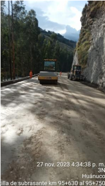
27 nov. 2023 4:34:38 p. m. 3N Huánuco tilla de subrasante km 95+630 al 95+750