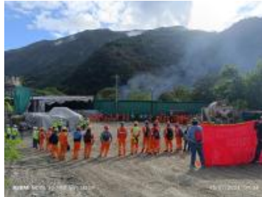
Ver imagen completa