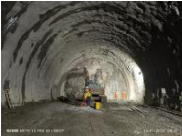
Ver imagen completa