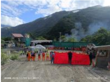
Ver imagen completa