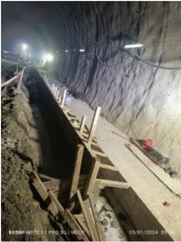
Ver imagen completa