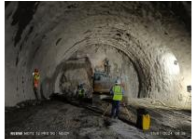
Ver imagen completa