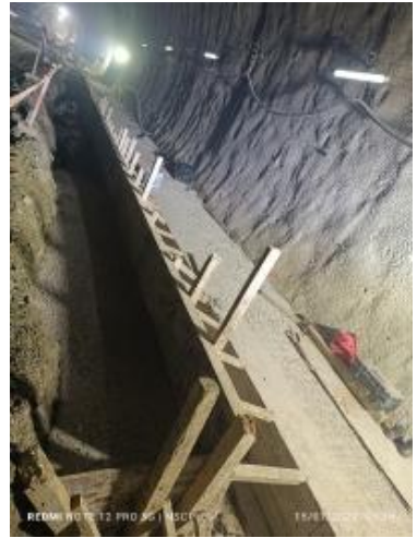
Ver imagen completa