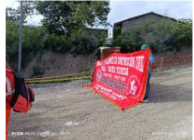
Ver imagen completa