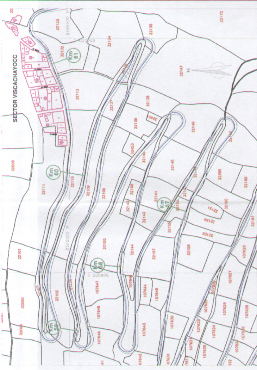
PLANO DE UBICACION Escala: 1/5000