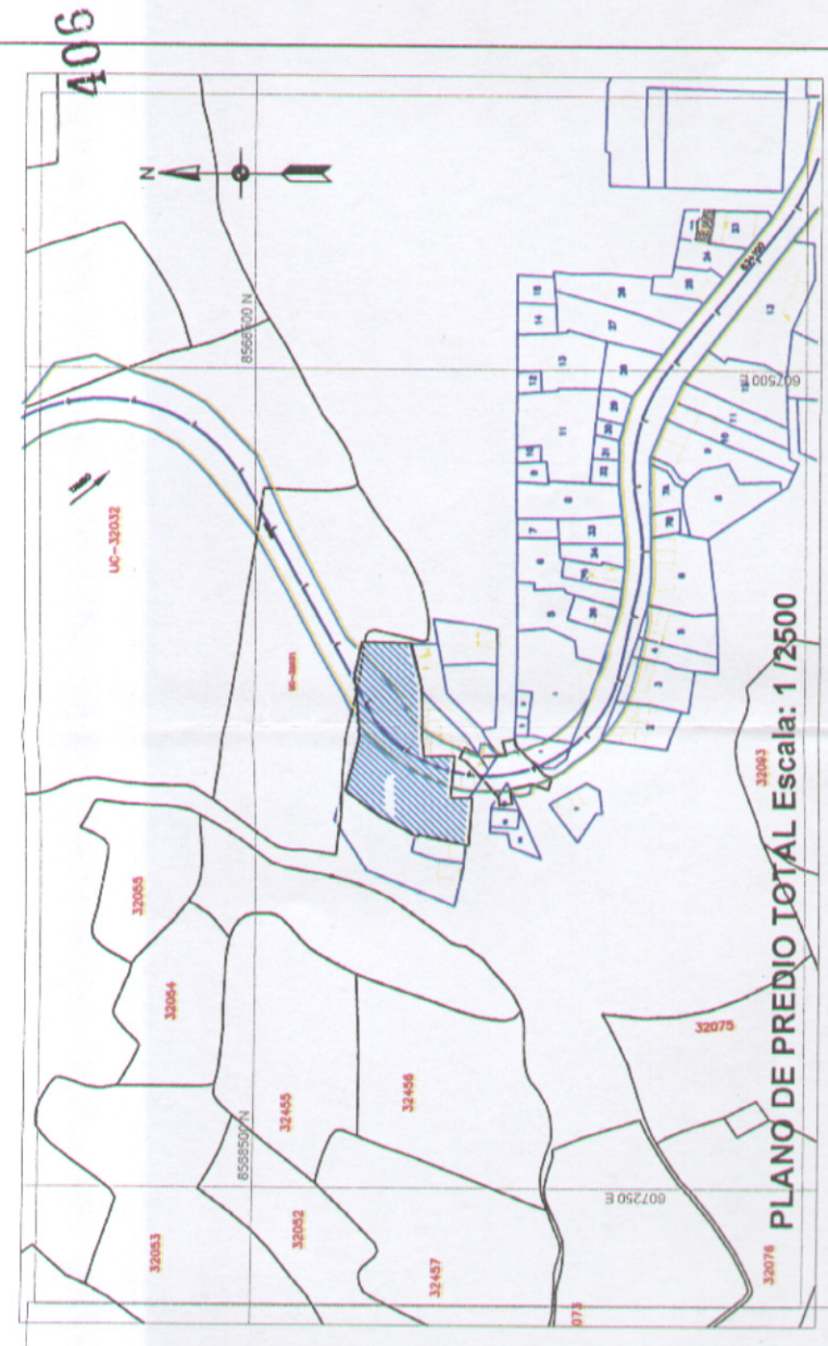
PLANO DE PREDIO TOTAL Escala: 1 / 2500

CONSORCIO WARI Ing. Willy Aljcarima Crisostomo Esp. en Afectaciones Prediales C.I.P. 97040