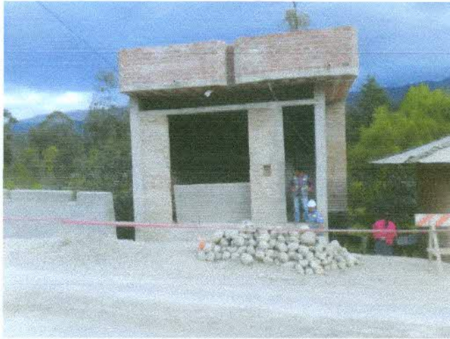
VISTA FRONTAL DEL PREDIO AFECTADO – NUEVA AFECTACION