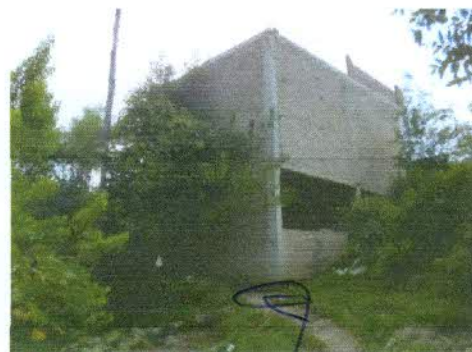
VISTA LATERAL IZQUIERDA, DEL PREDIO AFECTADO - NUEVA AFECTACION