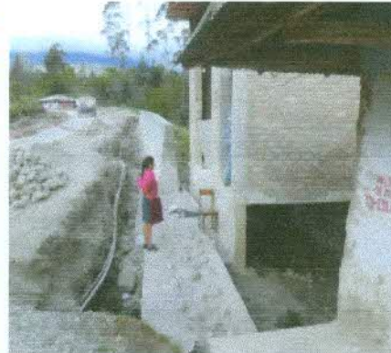
VISTA LATERAL DERECHA, DEL PREDIO AFECTADO - NUEVA AFECTACION