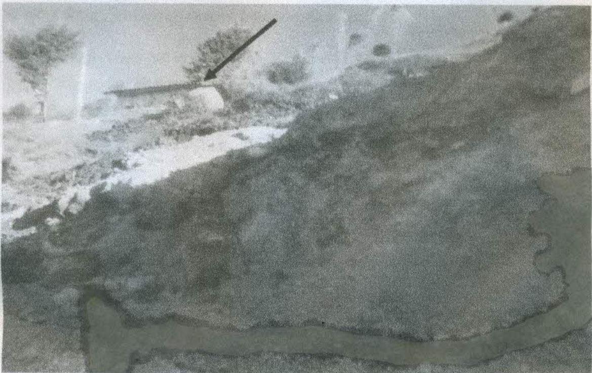
VIVIENDA QUE PUEDE SER AFECTADA DEBIDO AL DESLIZAMIENTO DE TIERRA