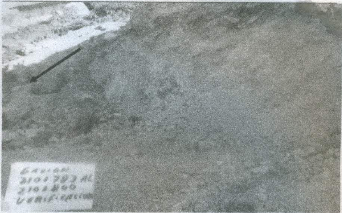
TERRENO DESLIZADO PRODUCTO DE LOS TRABAJOS DE EXPLANACIONES

Acruta & Tapia Ingenieros SAC – Consultoría Colombiana Corporación Peruana de Ingeniería