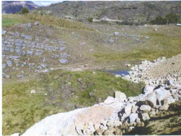
Ubicado en el Km 208+050 L.I, Sector Apan alto – Ampliación de DME. Con UC 57716 - Partida N° 11006526