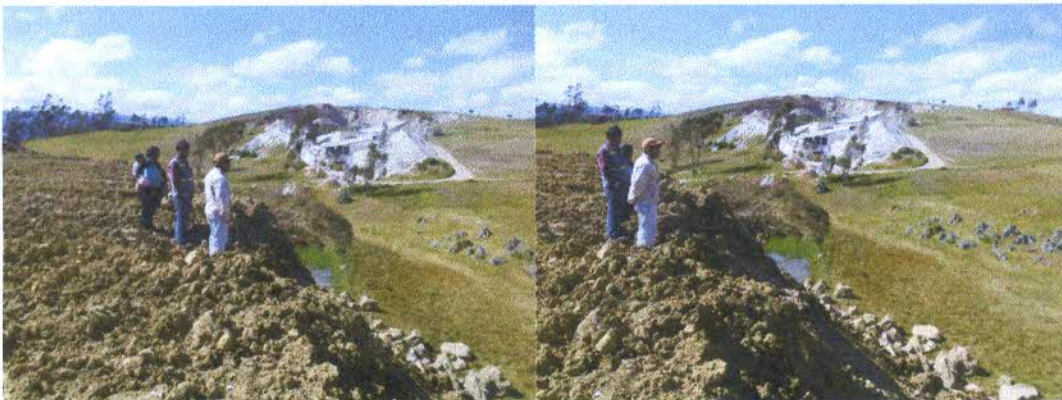
Vista Fotográfica donde se muestra la Ampliación de dicho DME, con presencia de los propietarios