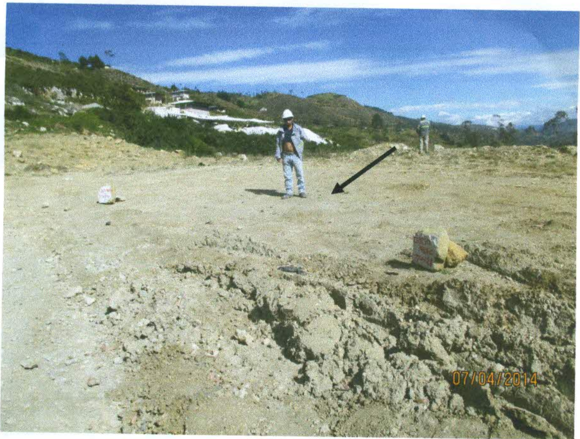
ZONA DE RELLENO QUE NO REQUIERE MURO DE CONTENCIÓN