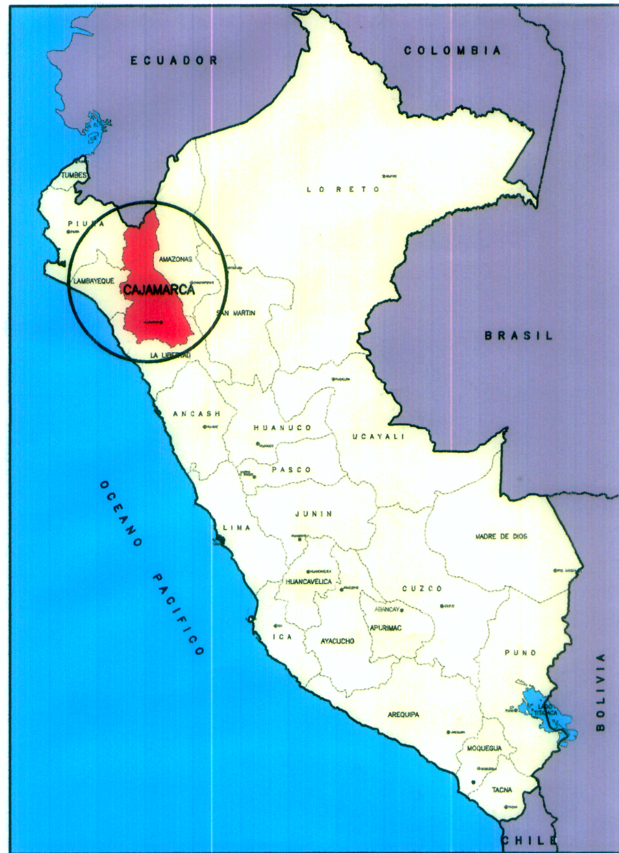
UBICACION A NIVEL NACIONAL