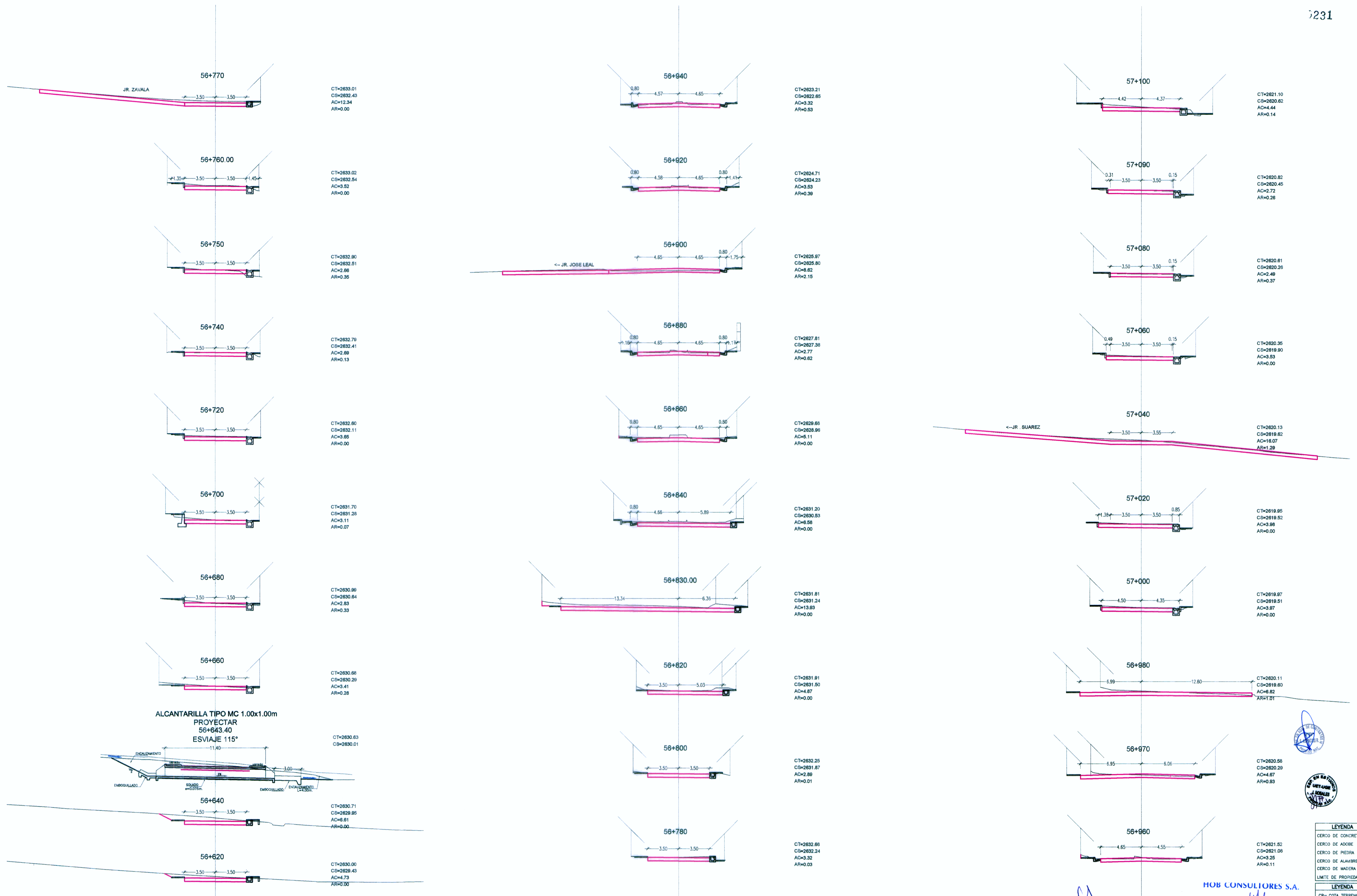
ALCANTARILLA TIPO MC 1.00x1.00m PROYECTAR 56+643.40 ESVIAJE 115°