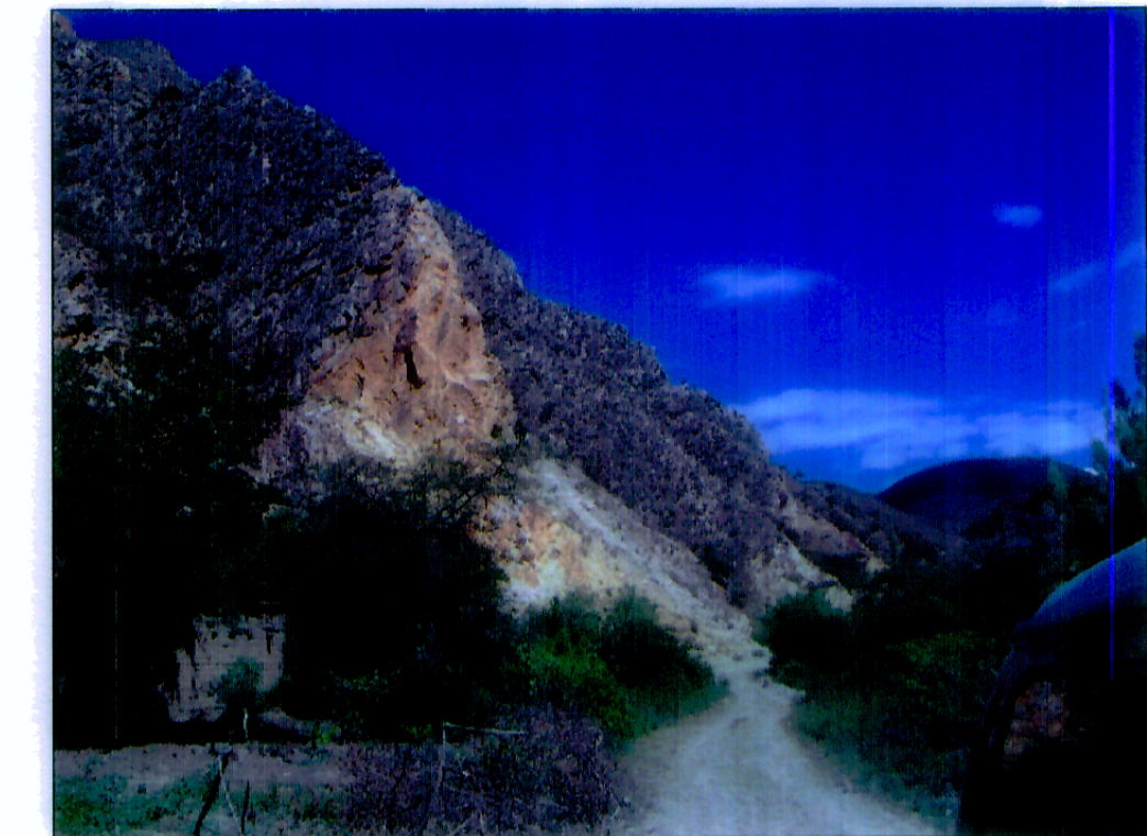
FOTO PANORAMICA CANTERA ROCA PALTAY