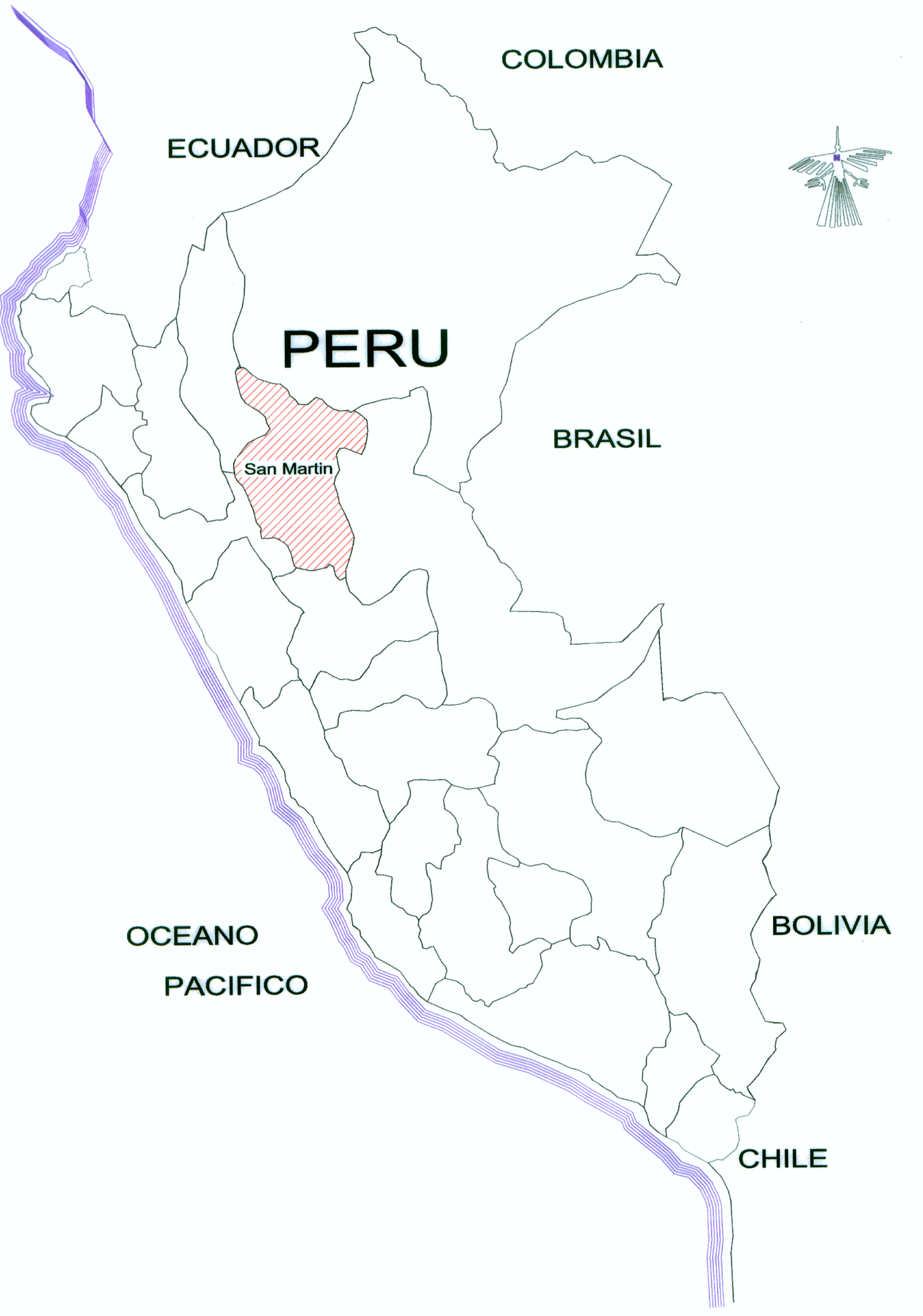
PLANO DE UBICACION S/E Inicio (Km. 00+000) del Tramo : Salida de Juanjui - Puente Juanjuicillo

[Signature] VIBERTO GERMAN YSURIAS ALEJO INGENIERO CIVIL Reg. CIP. N° 65525