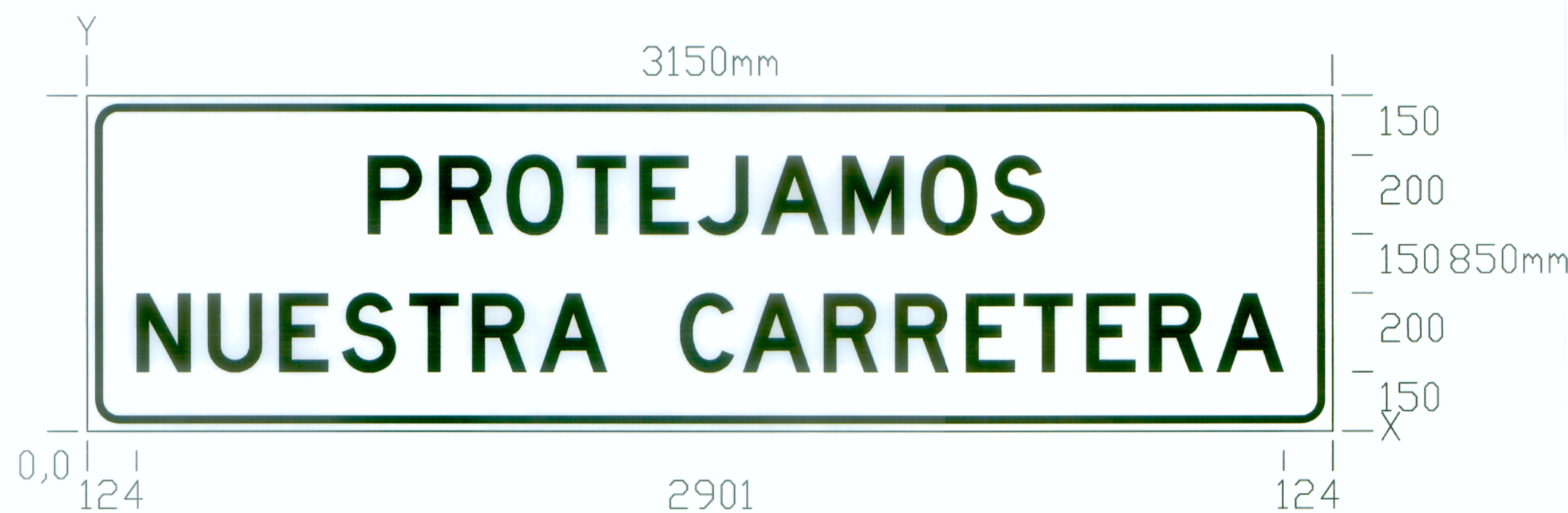
NOMBRE PROTEJAMOS PROTEJAMOS