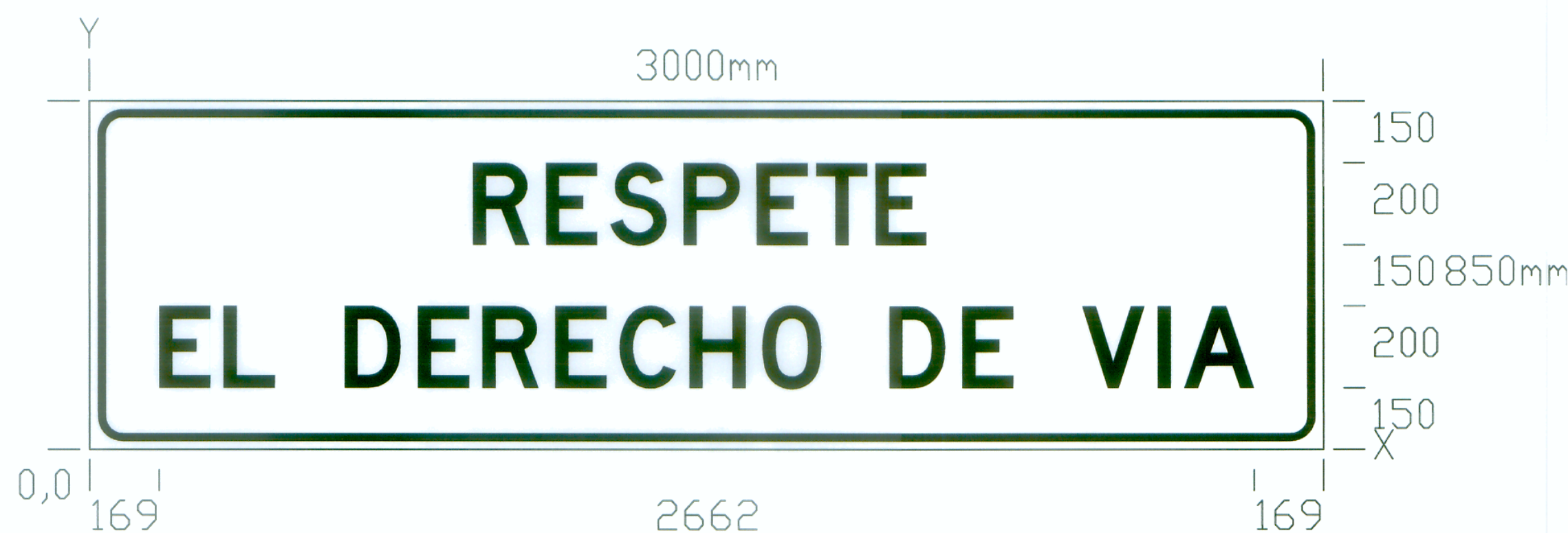
NOMBRE EL DERECHO DE VIA EL DERECHO DE VIA

NOTA: Se ha Utilizado la serie "C" del Manual de Dispositivos del Control del Tránsito Automotor para Calles y Carreteras Vigente