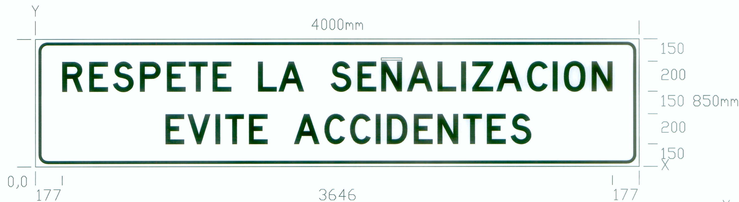
NOMBRE RESPETE LA SEÑALIZACION RESPETE LA SEÑALIZACION