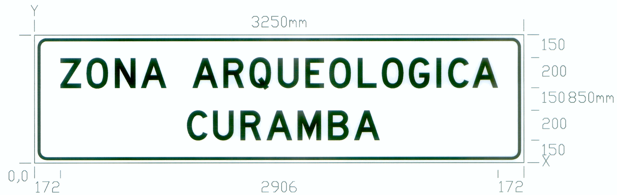
NOMBRE ZONA ARQUEOLOGICA ZONA ARQUEOLOGICA