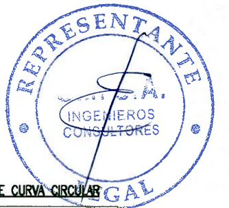
ELEMENTOS DE CURVA CIRCULAR