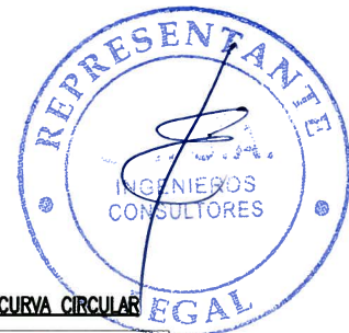
ELEMENTOS DE CURVA CIRCULAR