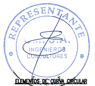
ELEMENTOS DE CURVA CIRCULAR