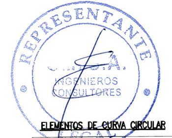
ELEMENTOS DE CURVA CIRCULAR