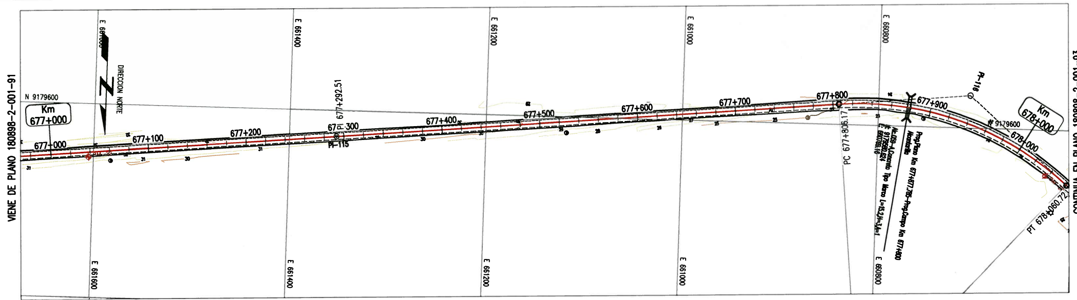
PLANTA ESC 1:2000