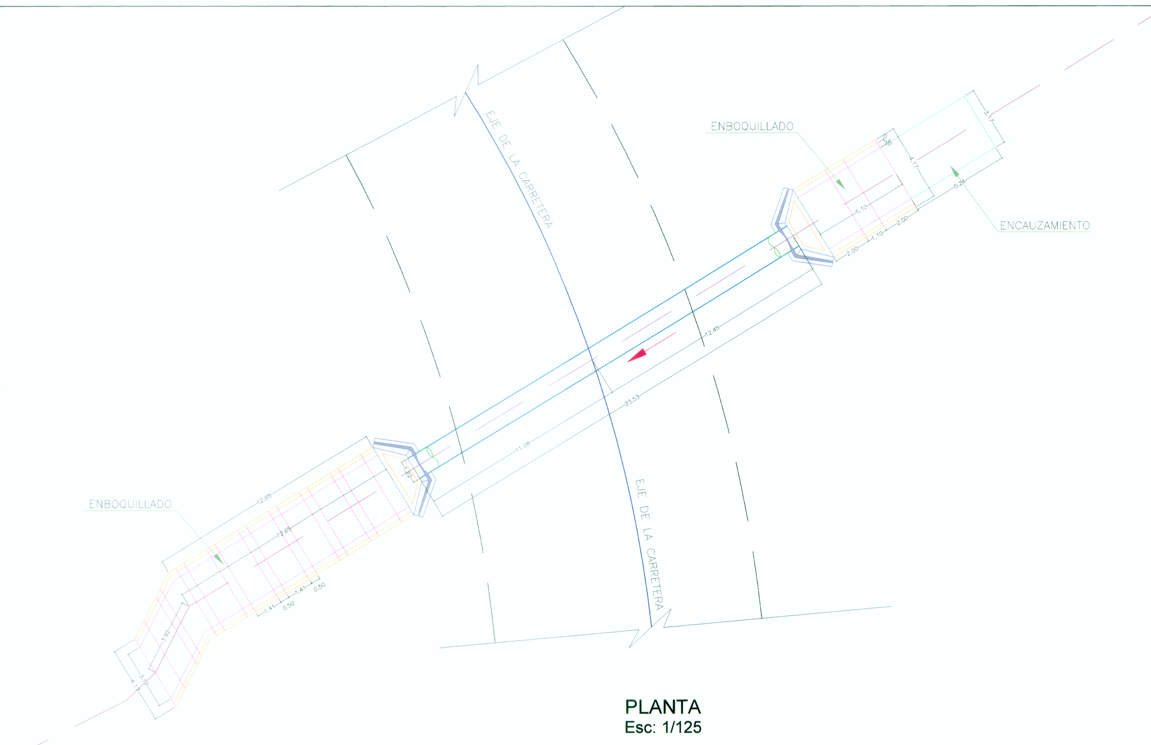
PLANTA Esc: 1/125